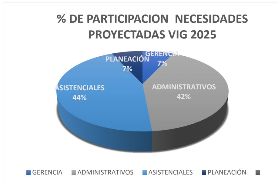
Grafica No 1

Como lo muestra la Gráfica No. 1, el mayor porcentaje de participación en el PAA (Plan Anual de Adquisiciones) corresponde a las necesidades proyectadas para la vigencia 2025, donde destacan los procesos ASISTENCIALES con el 44% , seguidos por los procesos ADMINISTRATIVOS con el 42% . Estos porcentajes se alinean directamente con las necesidades descritas. Esta distribución revela una prioridad entre atención directa al usuario (asistenciales) y soporte operativo (administrativos), Los procesos asistenciales lideran por su impacto en la prestación del servicio, mientras que los administrativos aseguran la gestión eficiente de recursos y documentación. Tanto gerencia como planeación representan áreas de soporte estratégico con menor volumen, enfocadas en dirección y proyección futura.